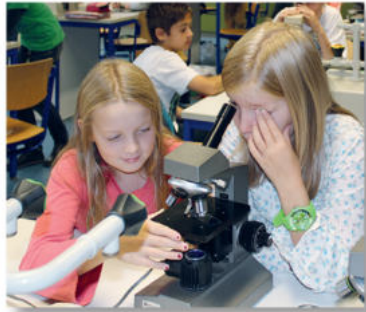
Mikroskopieren in einem der vielen Fachräume

Im künstlerisch-musikalischen Bereich der Schule stehen den Schülerinnen und Schülern atelierartige Fachräume zur Verfügung.