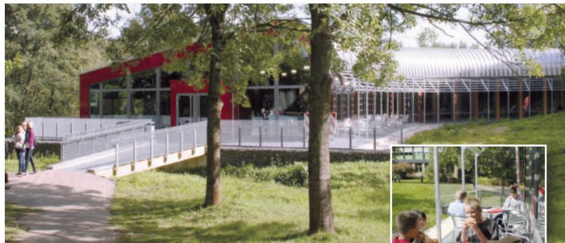
Mensabereich der Schule

Das Schulgelände wird von den meisten Schülerinnen und Schülern über gute Schulbusverbindungen erreicht, viele kommen auch mit dem Fahrrad.