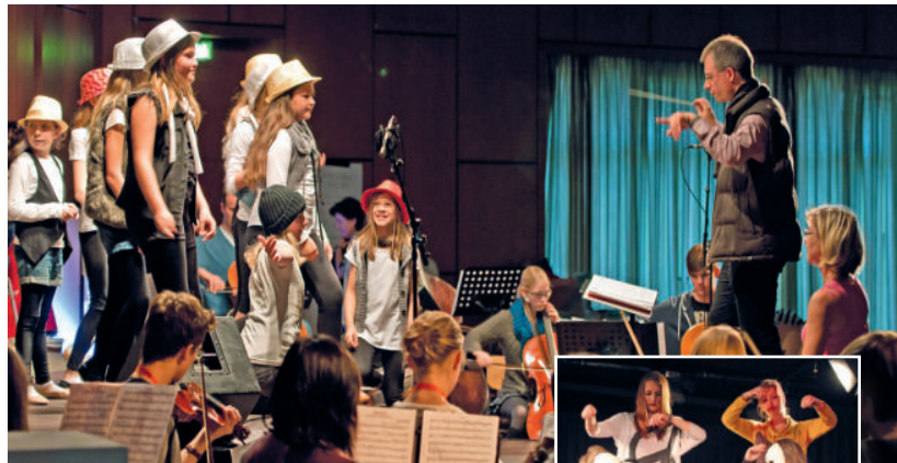
Eurode-Jugend-Orchester (EJO) und Theater-AG

Unsere Schule stellt allen Schülerinnen und Schülern einen Zugang zu einer leistungsstarken Plattform zur Verfügung (Microsoft Teams). Dokumente können gespeichert, geteilt und gemeinsam bearbeitet werden. Der Austausch in Kursen, untereinander und mittels Videokonferenzen ist in einem geschützten Bereich möglich, den nur Mitglieder der Schulgemeinschaft betreten können. Alle Schülerinnen und Schüler erhalten ein kostenloses Office 365 Paket und haben mit diesem ebenfalls Zugriff auf eine herunterladbare Version von Microsoft Office.