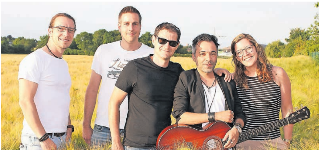
Die Band „Fahrerflucht“ spielt unplugged.