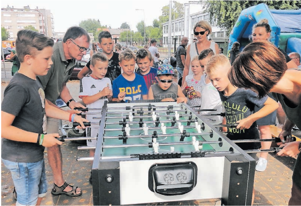
Sieht aus wie „normaler Tischfußball“, kann allerdings viel mehr – nämlich Jung und Alt oder behinderte und nicht behinderte Menschen beim Spielen verbinden.

Die robusten Tischfußball-Konstruktionen halten einiges aus, sind also nicht sonderlich wartungsanfällig. „Für die Stangen-Schmierung lasse ich trotzdem immer gleich etwas Silikonspray da – und klar, Bälle müssen natürlich auch gelegentlich ersetzt werden. Kein Problem“, führt