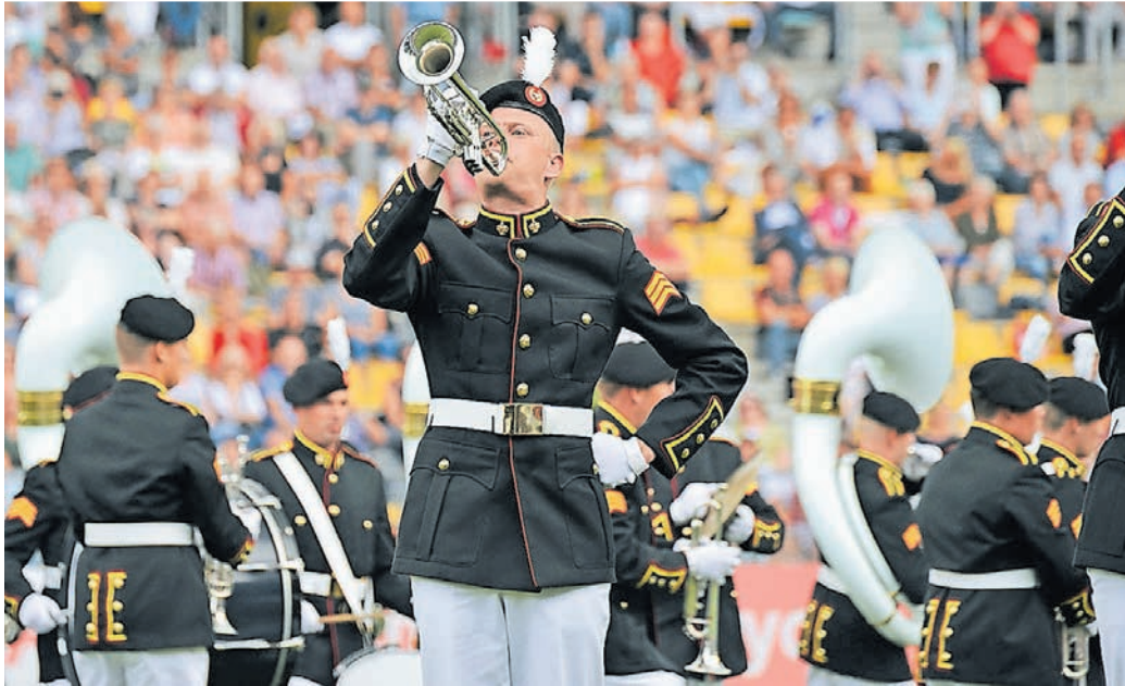
Akustisch und optisch beeindruckend sind die Darbietungen großer Marsch- und Showbands, die im Juli wieder an fünf WMC-Tagen im Parkstad-Limburg-Stadion auf dem Programm stehen.

Ob in Orchestern für Klassik, Kapellen für vorwiegend traditionelle Marschmusik, Harmonievereinigungen, Fanfarenzügen, in Pop-, Rock- oder Jazz-Bands eingesetzte Bläusersätze oder Solisten – das WMC hat sieben Jahrzehnte lang gezeigt, welche Spielarten Blasmusik hat und wie zeitlos sie geblieben ist. Das Festival ist zudem erklärtermaßen offen für Crossover und musikalische Experimente sowie neuen Entwicklungen und ist deshalb nachhaltige Quelle der Inspiration für an-