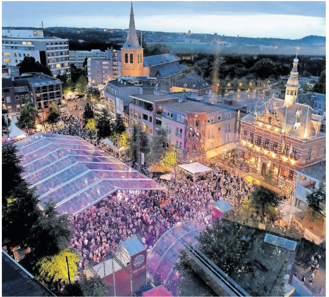
Blick von oben auf den rappelvollen Kerkrader Markt zum Finale des letzten WMCs im Jahr 2017.

be – insbesondere der auf fünf Tage verteilten Auftritte der Marsch- und Showbands mit ihren beeindruckenden Choreografien im Stadion – präsentiert das Festival an verschiedenen Orten hochkarätige Orchester, Bands und Künstler aus dem In- und Ausland, die unüberhörbar die musikalische Vielfalt der Blasmusik spiegeln. An vorherigen WMCs nahmen immerhin bis zu 20.000 Musikerinnen und Musiker aus aller Welt teil. Die wiederum zogen in Spitzenjahren rund 300.000 Besucher zu Wettbewerben und Konzerten. Trotz global anhaltender Pandemie-Auswirkungen und des Kriegs in der Ukraine rechnen die Organisatoren mit großer Resonanz – bei den Teilnehmenden im wahrsten Sinne des Wortes, aber auch beim Publikum. Das Festival stehe schon immer für Völkerverbindendes und (kulturelle) Vielfalt, betonen die Veranstalter. Für viele werde das musikalische Großereignis willkommenen Abwechslung und ein besonderes Statement für das friedlich-fröhliche Miteinander aller Kulturkreise und Generationen sein. Ein Großteil der Teilnehmerschar wird dennoch aus den Niederlanden selbst kommen, wo Blasmusik nach wie vor überaus beliebt ist. Die Nachbarländer Belgien