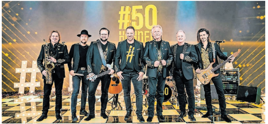
Die Höhner sind live zu erleben.