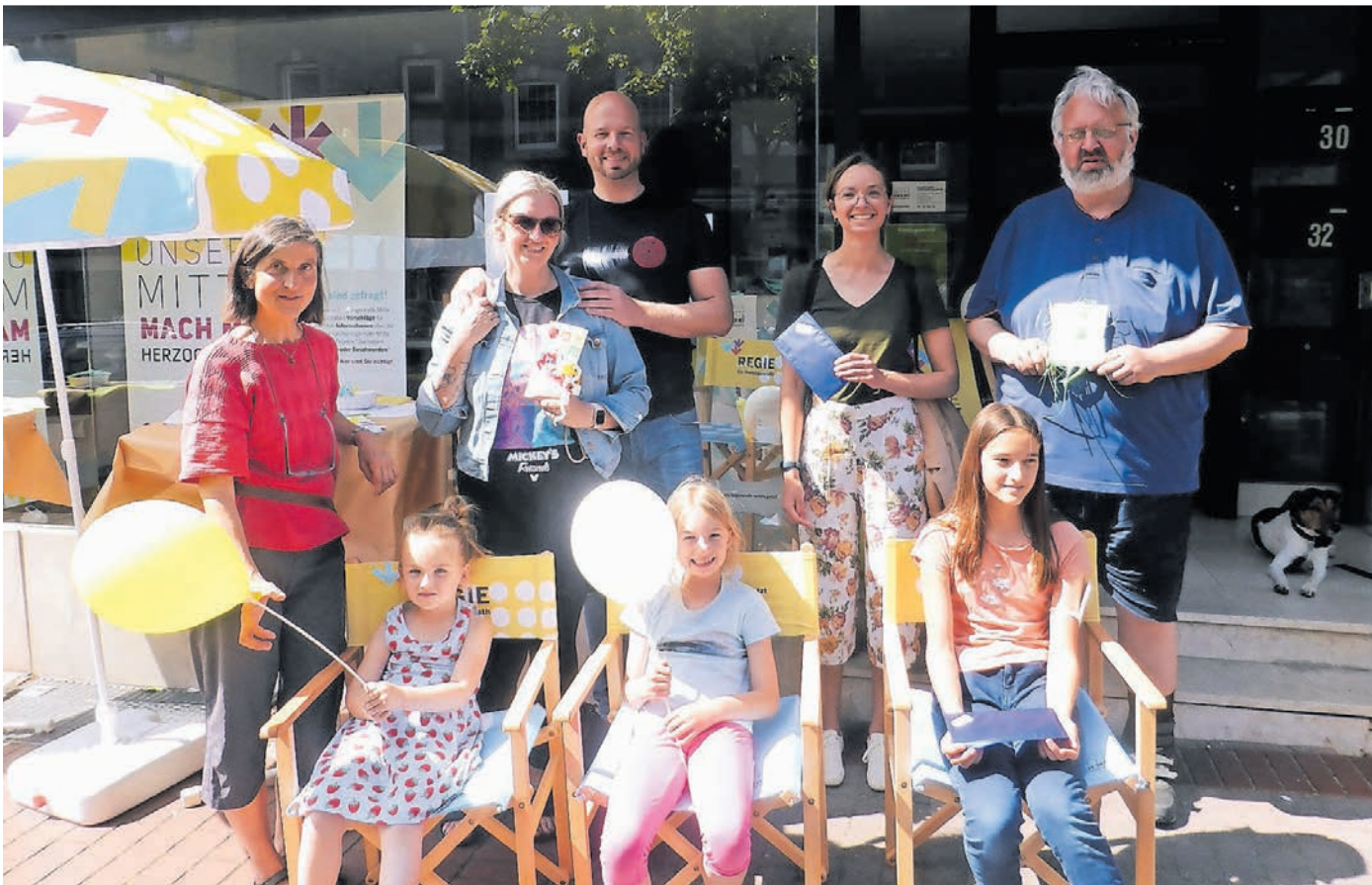
Die Gewinner der Rätsel-Tour durch die Mitte.