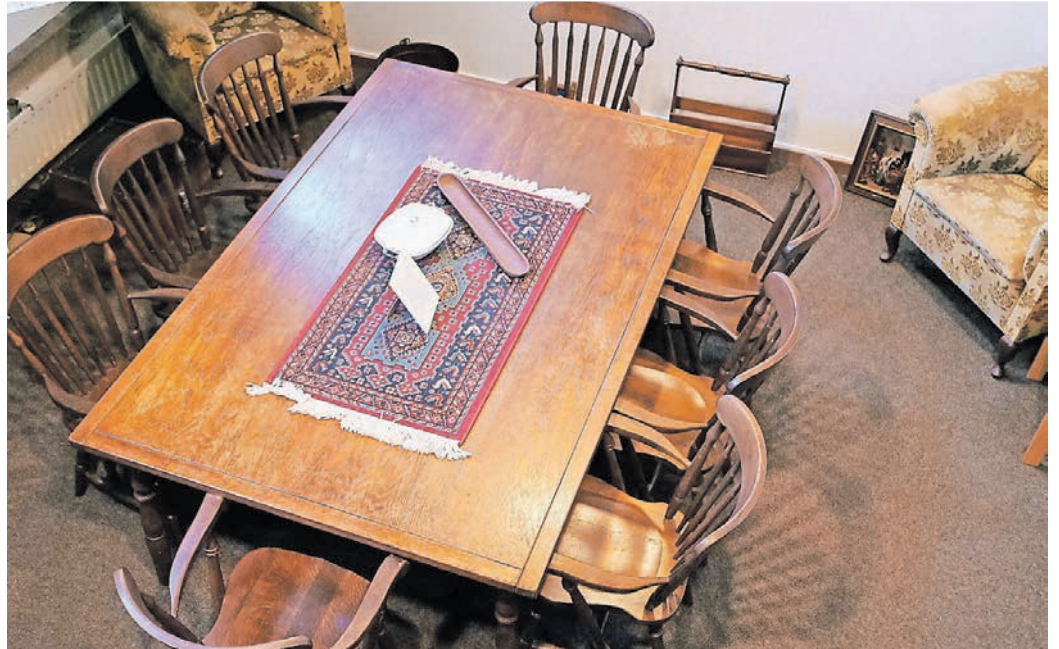
Das Rätsel „Die Hochzeit“ ist für bis zu 14 Personen gedacht. Ein Teil der Gruppe knabbert auf dieser Ebene an der Lösung.