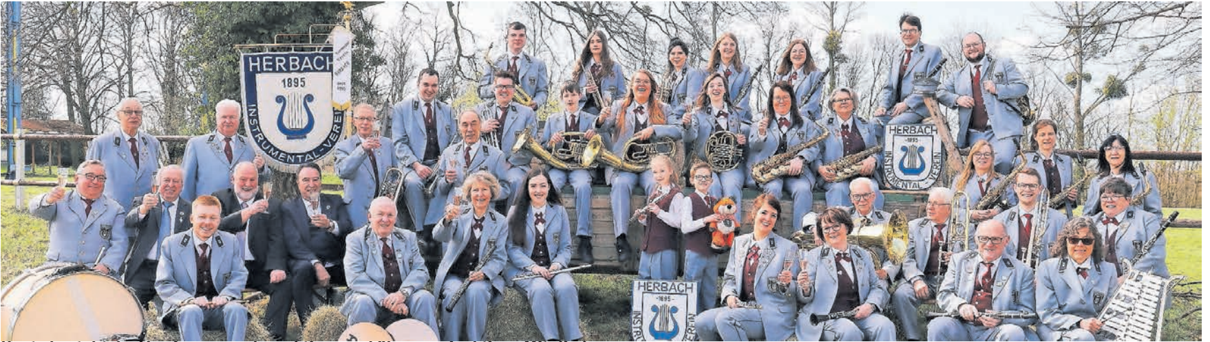
Heute besteht der Verein aus rund 40 aktiven und über 200 inaktiven Mitglieder.