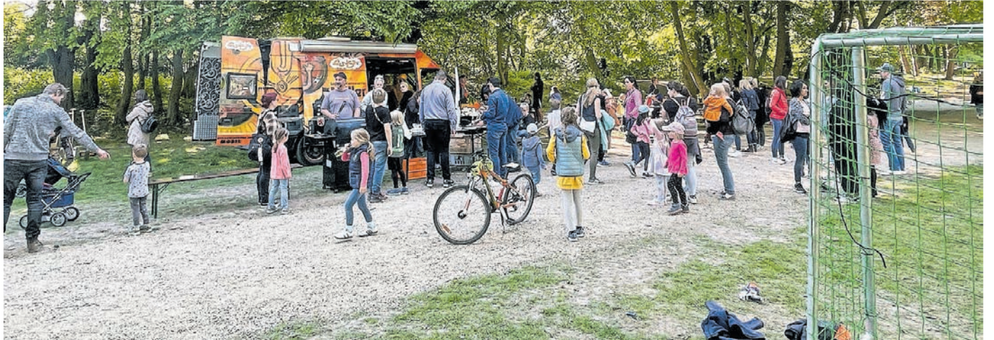
Am „FunSit“-Mobil des Jugendamtes gab es zur Eröffnung gegrillte Würstchen und Maiskolben.

Erst vor wenigen Wochen wurde der städtische Spielplatz in der Kircheichstraße/ Ecke Zellerstraße offiziell neu eröffnet. Bei strahlendem Sonnenschein präsentierten Vertreterinnen und Vertreter der Verwaltung und Politik und natürlich die Kinder mit ihren Eltern ein Ergebnis, das sich sehen lassen kann. Das attraktive Spielplatzgelände in der Kircheichstraße/ Ecke Zellerstraße im Stadtteil Kohlscheid ist das Ergebnis einer im Oktober 2020 durchgeführten Bürgerbeteiligung. Damals wurde der Wunsch nach Spielgeräten für alle Altersgruppen und die Einrichtung einer Klettermöglichkeit geäußert. Im Februar 2021 stimmte der Jugendhilfeausschuss der vorgestellten Entwurfsplanung für die Neugestaltung des Spielplatzes zu und beauftragte die Verwaltung mit der Herstellung des Spielplatzes sowie der Anschaffung der Spielgeräte und Ausstattungsgegenstände. Gemäß den Vereinbarungen mit der Grundstücksentwicklungsgesellschaft Herzogenrath mbH als zuständigen Erschließungsträger für das