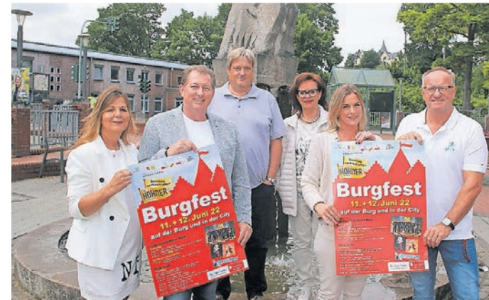
Der Vorstand des Gewerbevereins freut sich auf die Burgfest-Veranstaltungen.

Aufgrund der Baumaßnahmen kann es in diesem Jahr leider keine Burgführungen geben. Das Café Burg Rode hat auf der Terrasse im oberen Burghof geöffnet und die Limburger Ritterschaft nimmt die BesucherInnen mit auf eine Zeitreise und bietet in ihrer mittelalterlichen Taverne auf der Wiese vor dem Haupteingang der Burg neben Met und Bier die bekannte und beliebte Aachener Karlswurst. Gefreut werden darf sich auf den Kunst- und Handwerkermarkt im Vorbereich der Burg. Zahlreiche bildende Künstler und Handwerker verschiedenster Rubriken gewähren einen Einblick in ihr Können. Tau-