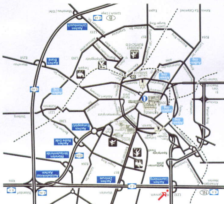
CHIO Bad Aachen